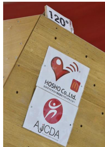
競技ウォールロゴ