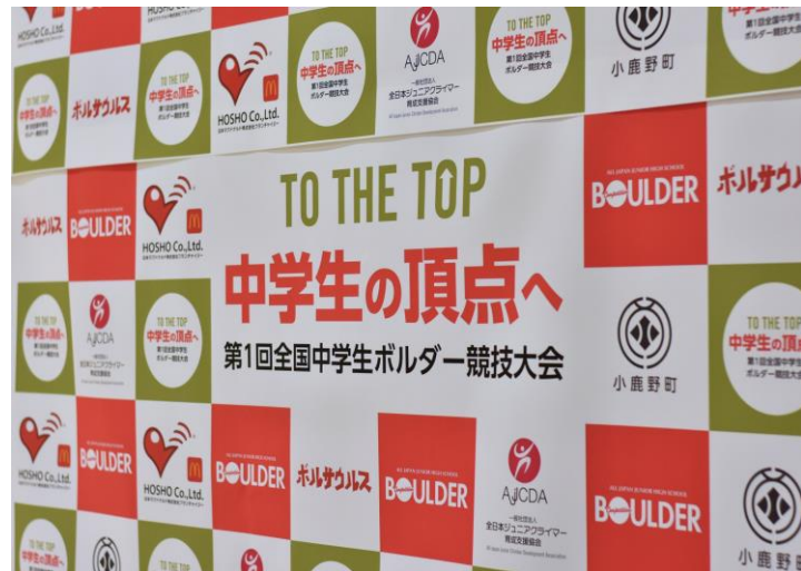
インタビューボード