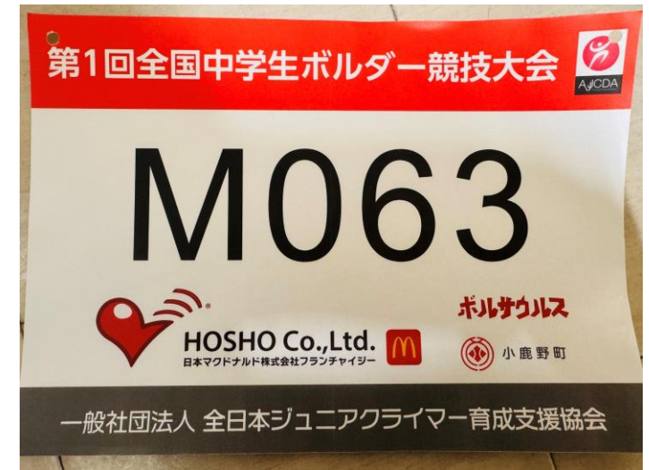
選手が背中につけるゼッケン

※2024年第1回全国中学生ボルダークロム大会で使用した掲示物の画像です。 参考画像となります。